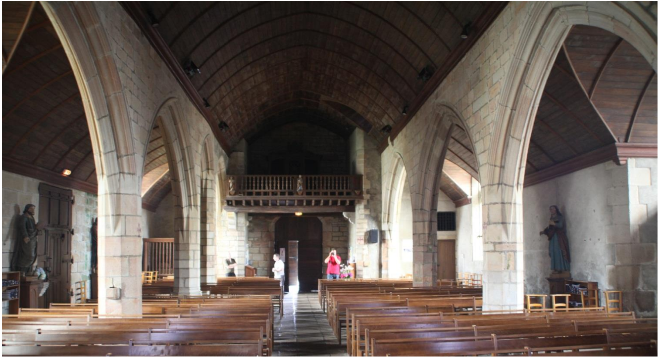
Übergetitelt: „Das Fotoduell“