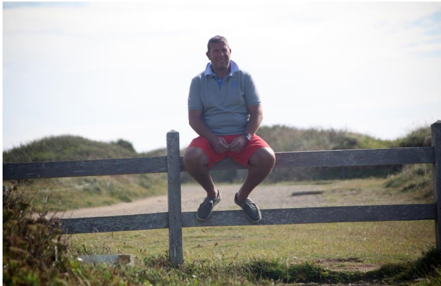
Übergetitelt: „Die Suche nach Dorli“